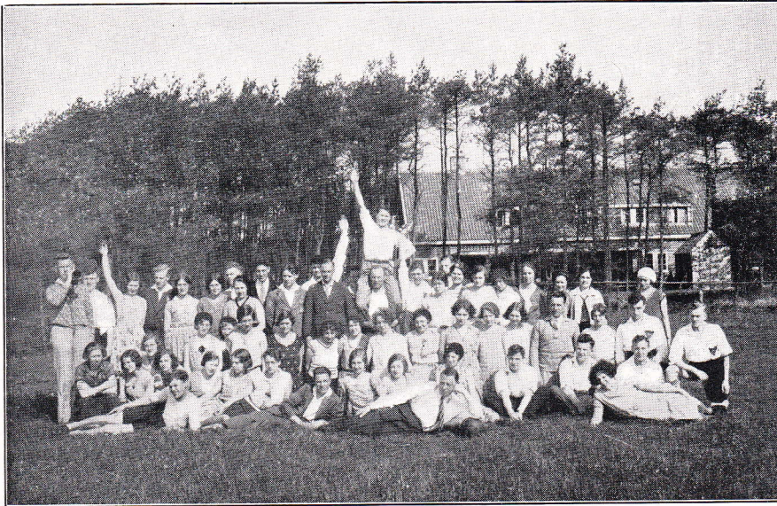
Herinnering aan ons eerste bezoek aan Oud-Leusden in 1933.